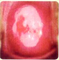
Large, thick, dull acetowhite lesion ก่อนการจี้เย็น