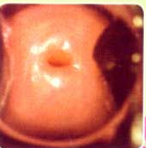
4 months after หลังจากจี้เย็น 4 เดือน

สตรี ที่ควรได้รับการตรวจหาความผิดปกติของปากมดลูกโดยวิธีใช้น้ำส้มสายชู