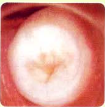
Immediately after หลังการจี้เย็นทันที